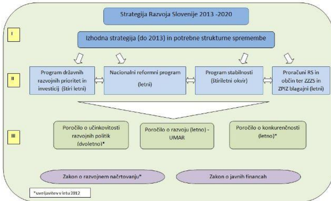
Slika 2: Razvojni dokumenti